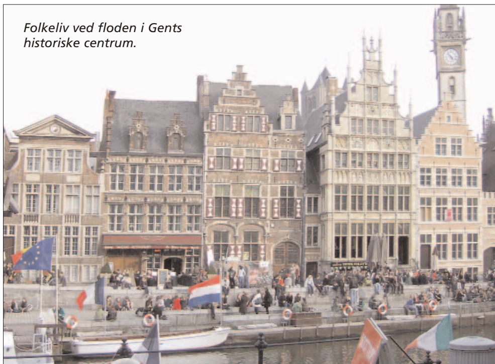
Folkeliv ved floden i Gents historiske centrum.