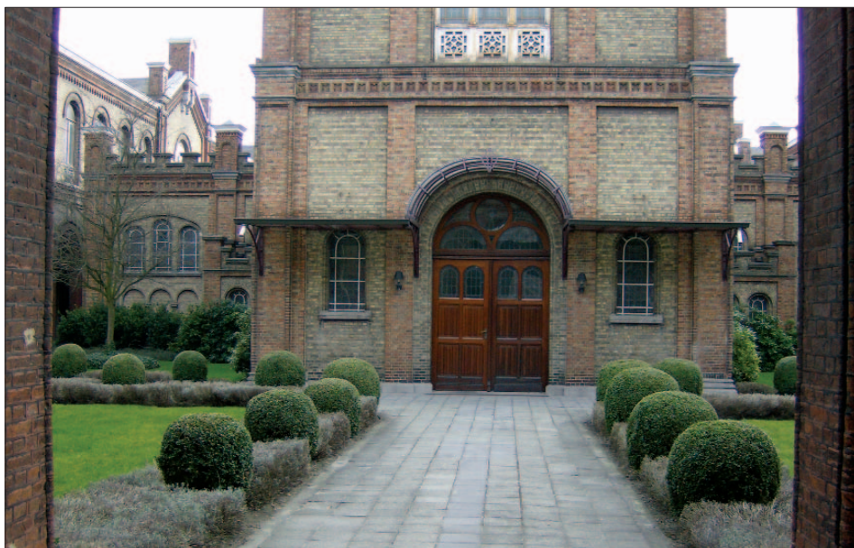
Guislain hospitalets indgangsparti.

I øvrigt: mødet var vellykket, alle var glade, vi kom godt hjem og ser, kun en anelse betænkelige – og forventningsfulde – frem mod værtskabet for det kommende "Expert Meeting" her i Risskov i juni måned.