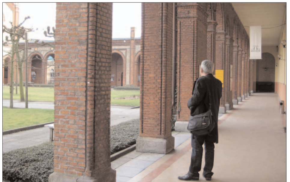
Et blik fra kolonnaden ud i en af hospitalets gårdhaver.

"Brothers of Charity" står stadig bag en substantiel støtte til både hospitalet: "Psychiatrisch Centrum Dr. Guislain" og Museum Dr. Guislain, som har en stor del af det oprindelige anlæg fra 1857 til sin disposition. Faktisk har en del af museets etagemeter sine steder en vis BZ-atmosfære – rum og korridorer står uistandsatte og venter på, at man får frigjort ressourcer til at fylde dem med indhold.